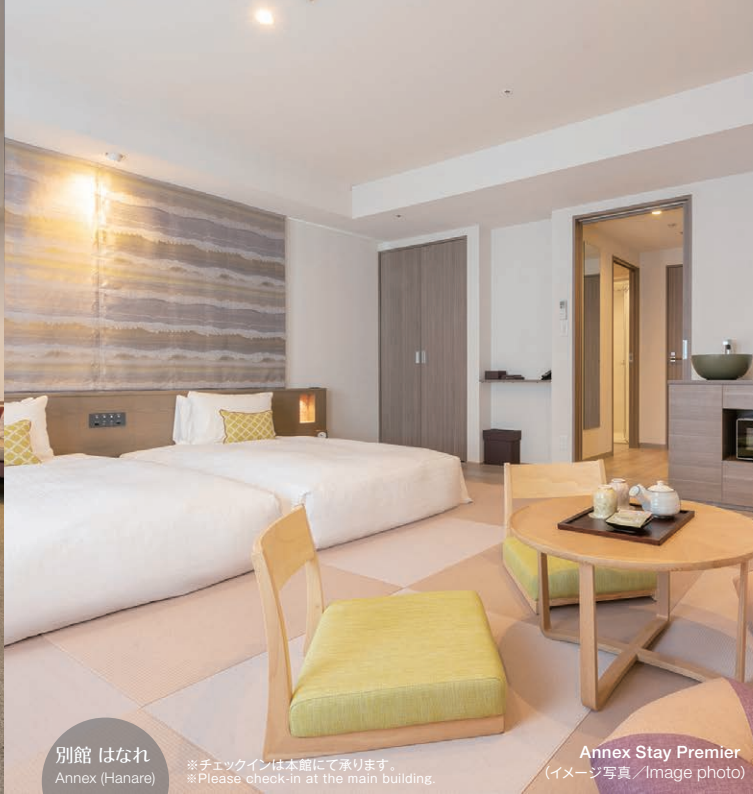
別館 はなれ Annex (Hanare)