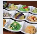
盛付例(写真はイメージです) Serving sample

豊富なメニューからお選びいただける朝食を別途有料でご用意しております。Wide variety of menu selections are available with extra charge.