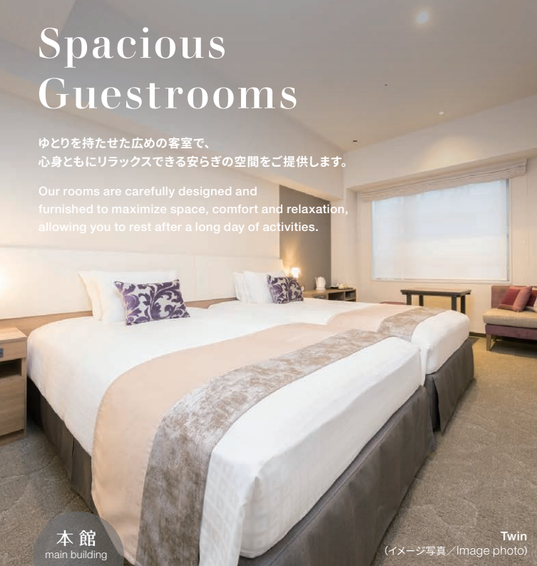
本館 main building

Our rooms are carefully designed and furnished to maximize space, comfort and relaxation, allowing you to rest after a long day of activities.