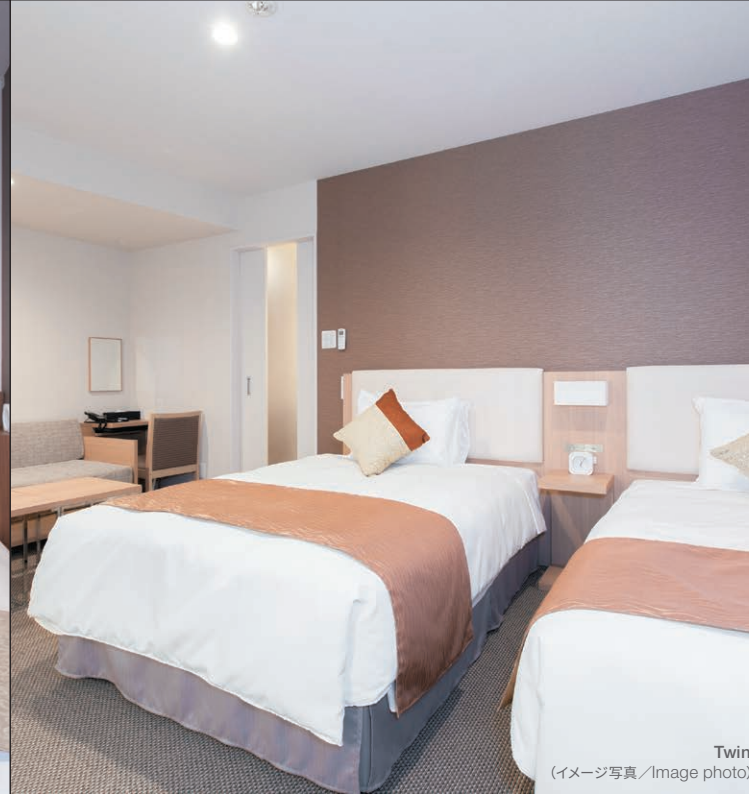
Twin (イメージ写真/Image photo)