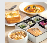
盛付例 (写真はイメージです) Serving sample

お部屋でゆっくりお召し上がりいただける朝食を用意しております。厳選素材で身体に優しい保存料無添加の食材を使用した手作りのお料理です。