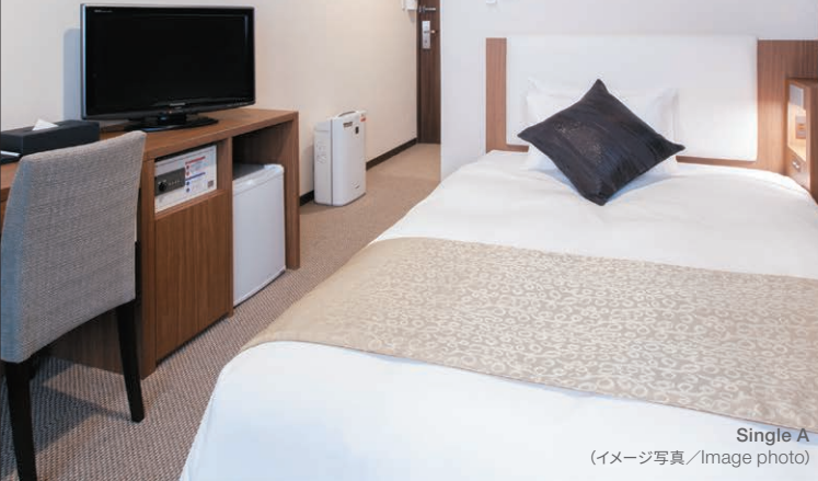
Single A (イメージ写真/Image photo)

Our rooms are carefully designed and furnished to maximize space, comfort and relaxation, allowing you to rest after a long day of activities.