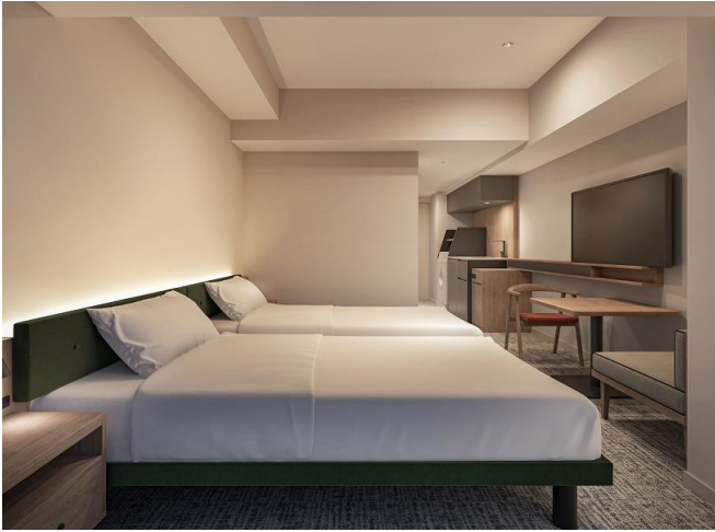
「レジデンシャルツイン」完成イメージ