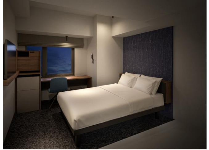
「モデレートダブル」完成イメージ図