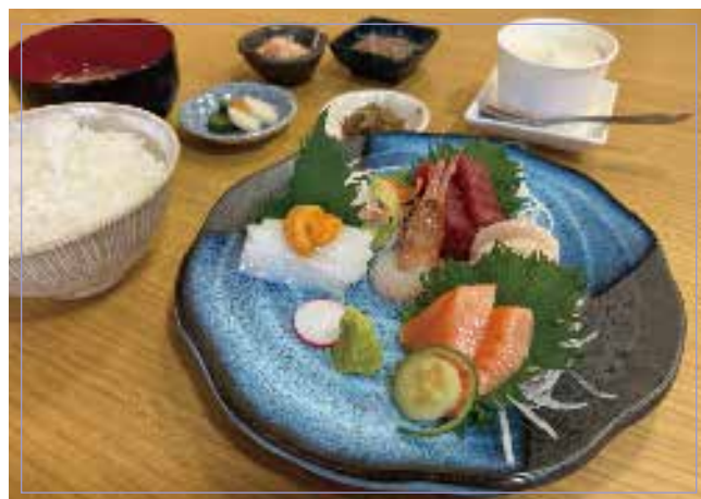
什錦刺身 （藍金槍魚、扇貝、鮭魚、蝦、魷魚、海膽） 4種 米飯・蟹肉味噌湯 冰淇淋