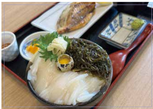
鮭魚生魚片海帶蓋飯 (海帶、鮭魚刺身、生雞蛋)