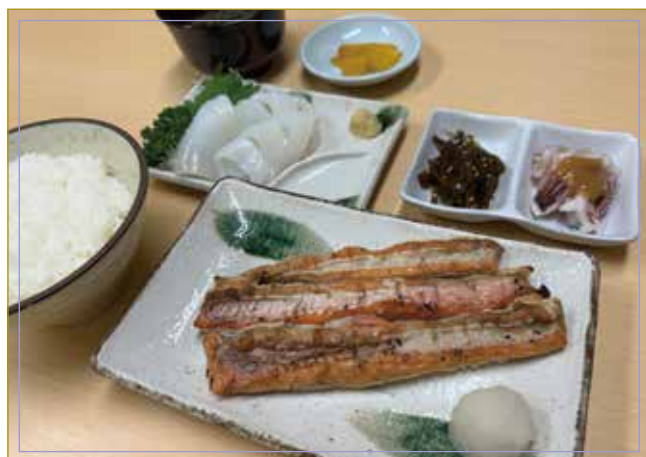
烤魚(請從下面選擇)