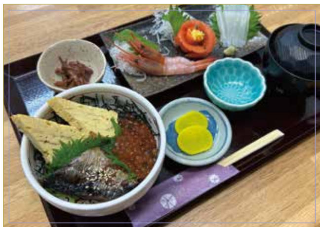
自製鮭魚糖醬油煮碗 （鮭魚糖醬油煮、玉子燒・鮭魚子）