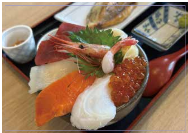
海鮮碗 (蝦子、魷魚、鮭魚、章魚、 金槍魚 、鮭魚子)