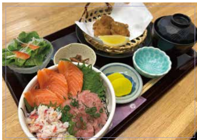
海鮮碗（常規尺寸） （鮭魚、松蟹、蔥托羅）