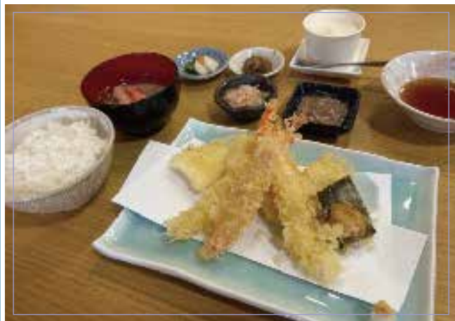
天婦羅拼盤 （蝦子、扇貝、魷魚、螃蟹、海膽天婦羅） 4種 米飯・蟹肉味噌湯 冰淇淋