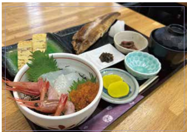
海鮮碗（常規尺寸） （甜蝦、魷魚、飛魚子）