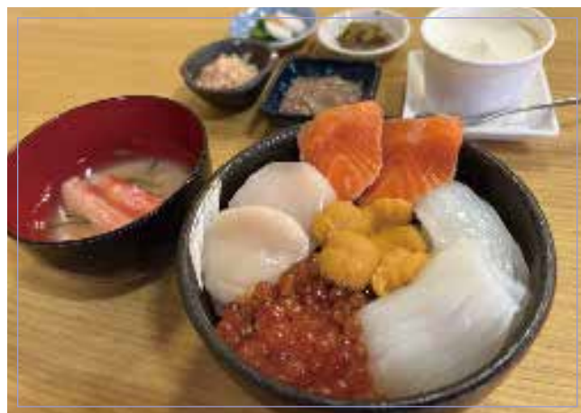
海鮮碗 （海膽、鮭魚籽、鮭魚、扇貝、魷魚） 4種 蟹肉味噌湯 冰淇淋