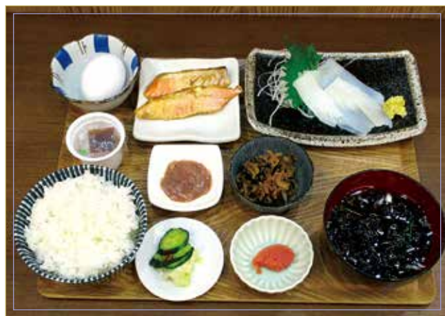
魷魚刺身 烤鮭魚 生蛋、小菜、納豆 醃菜、味噌湯、鱈魚子、鹹魚