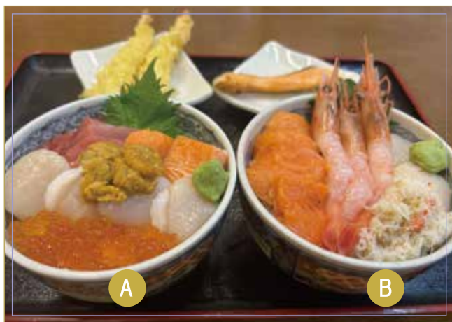
海鮮碗 請選擇A或B A (金槍魚、鮭魚、扇貝、鮭魚子、海膽) B (蝦子、鮭魚、扇貝、蟹) 烤鮭魚或蝦天婦羅 味噌汁