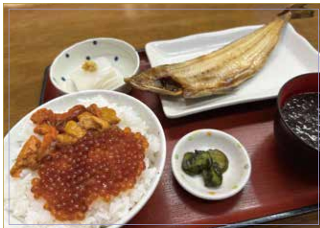
海膽鮭魚子碗 烤阿特卡鯖魚 半身 生魚片小碗 鮪魚或扇貝 海苔味噌湯・醃菜