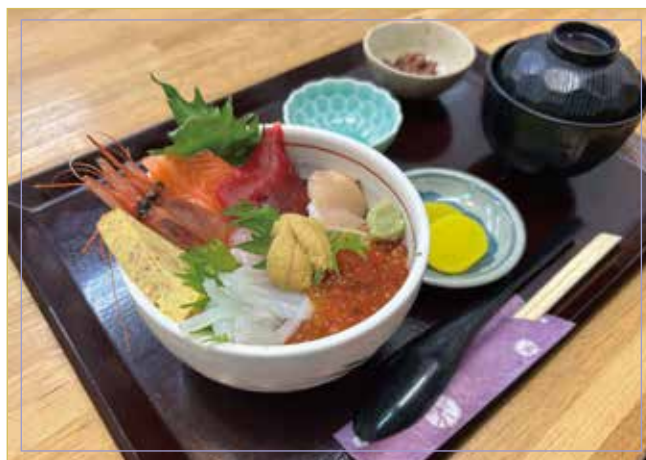
8種海鮮蓋飯 （海膽、鮭魚子、扇貝、金槍魚、鮭魚、甜蝦、魷魚、玉子燒）