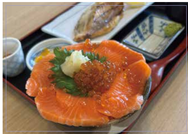
鮭魚生魚片和鮭魚子碗 (鮭魚刺身・鮭魚子)