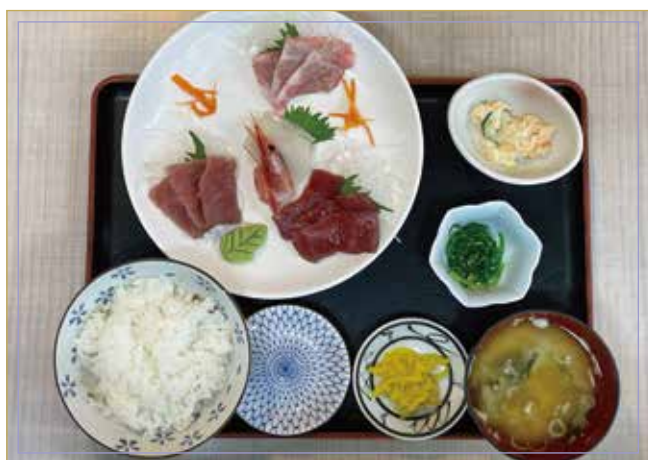
海峽金槍魚 三種生魚片套餐 (紅肉、中脂金槍魚、大金槍魚)