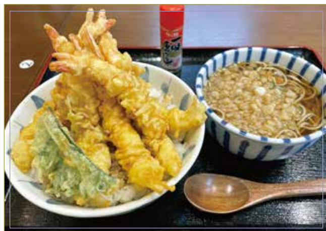
天婦羅碗 (蝦天婦羅・蟹天婦羅) 熱蕎麥麵