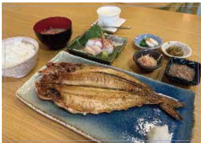
烤阿特卡鯖魚 什錦刺身（魷魚、扇貝、和蝦） 4種 米飯・蟹肉味噌湯 冰淇淋