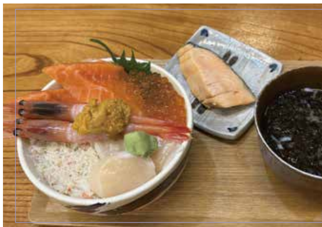
海鮮丼 (サーモン、イクラ、カニ・ホタテ・ウニ・エビ) 焼鮭・味噌汁