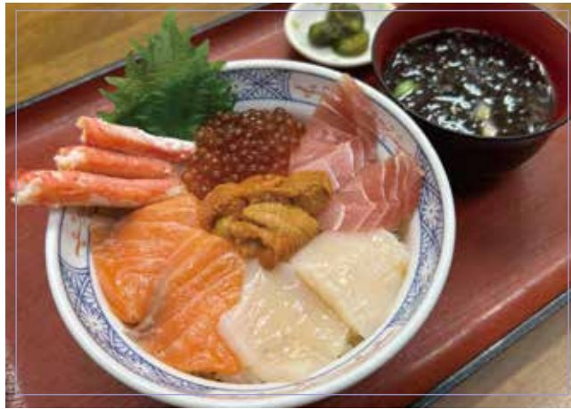
海鮮6色丼 (うに、カニ、ほたて、いくら、マグロ、サーモン) 海苔味噌汁・漬物