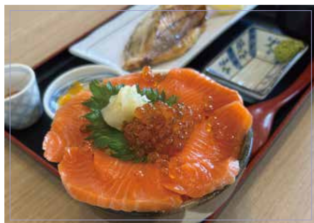
いくらサーモン親子丼 (いくら・サーモン刺)