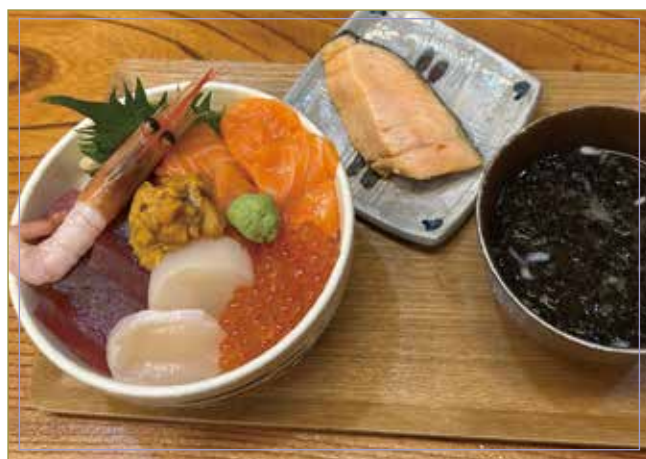
東急ステイ丼 (マグロ・サーモン・ホタテ・イクラ・ウニ・エビ) 焼鮭・味噌汁