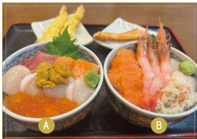
海鮮丼 A・Bからお選びください A (マグロ・サーモン・ホタテ・イクラ・ウニ) B (エビ・サーモン・ホタテ・カニ) 銀鮭焼 又はエビの天ぷら 味噌汁