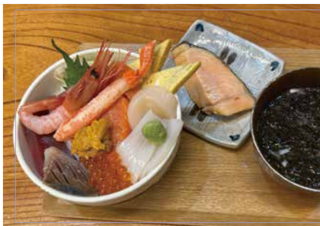
虹色丼 (マグロ・ハマチ・サーモン・ホタテ・イカ・アジ イクラ・ウニ・カニ、エビ) 焼鮭・味噌汁