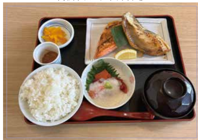
焼き魚2種 (鮭・ほっけ) 海鮮山かけ 味噌汁、塩辛、漬物