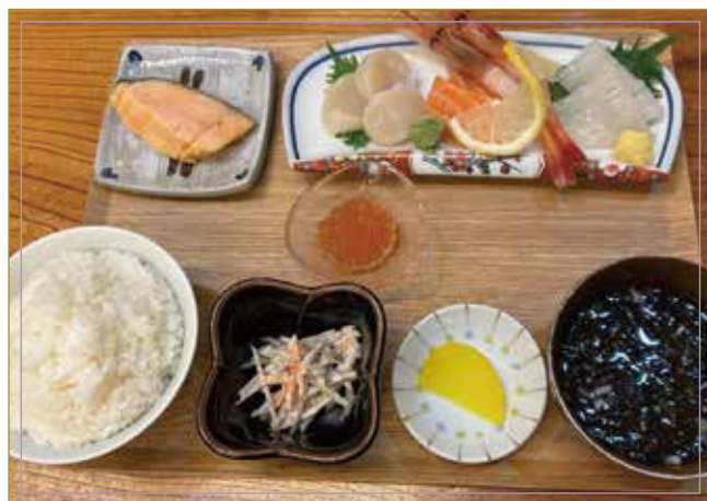
刺身盛合せ (サーモン・ホタテ・エビ・イカ・イクラ) 焼鮭・小鉢・ご飯・味噌汁

※丼ぶりは酢飯です。※お料理の内容は季節や漁の関係により一部変更する場合があります。