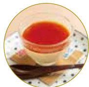
あらかき特製プリン