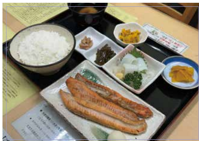
焼き魚(3種よりお選び下さい)