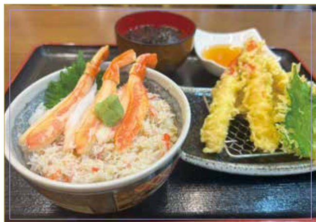
カニ丼 カニ天ぷら 味噌汁