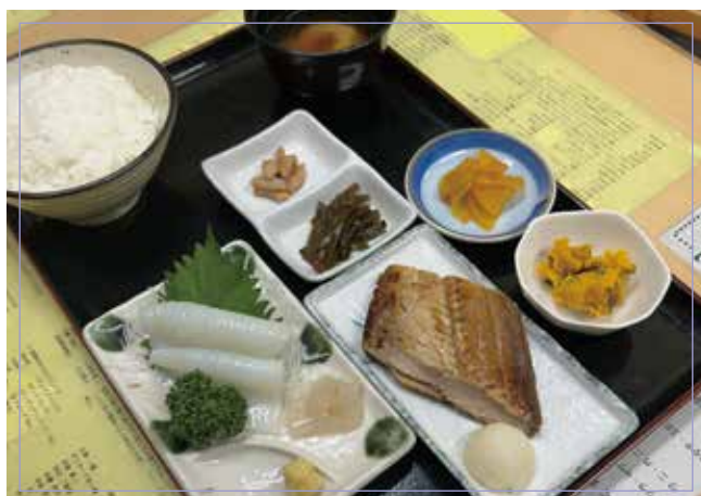
イカ刺身又はイカソーメン