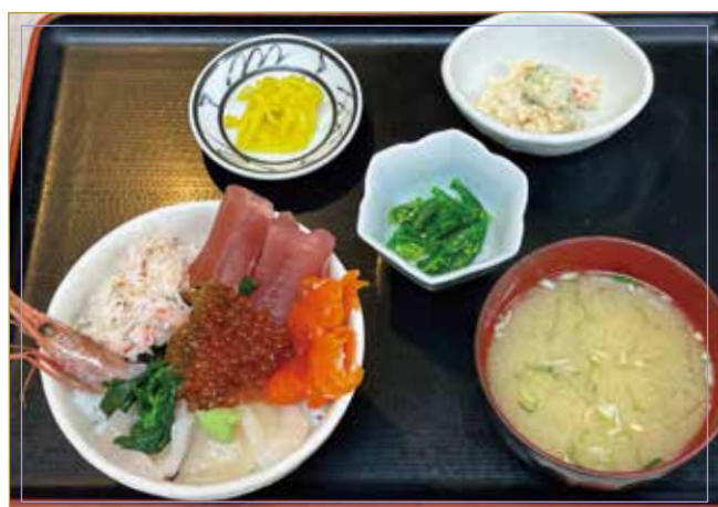
海鮮丼 (イクラ、マグロ、ホタテ、サーモン、エビ、カニ)