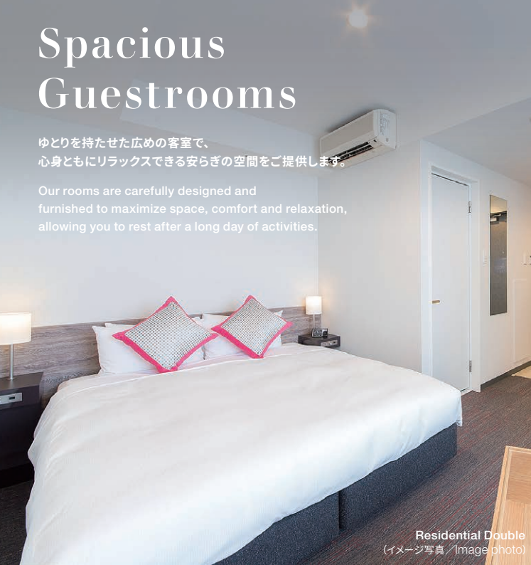
Residential Double (イメージ写真/Image photo)

Our rooms are carefully designed and furnished to maximize space, comfort and relaxation, allowing you to rest after a long day of activities.