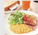
盛付例(写真はイメージです) Serving sample

豊富なメニューからお選びいただける朝食を別途有料でご用意しております。Wide variety of menu selections are available with extra charge.