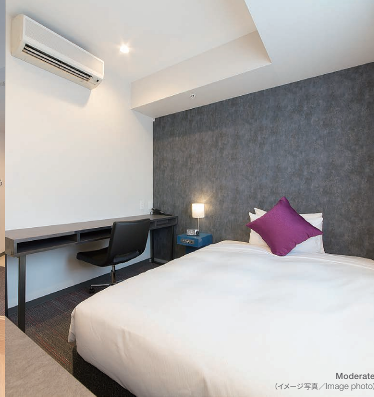
Moderate (イメージ写真/Image photo)