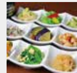
盛付例(写真はイメージです) Serving sample