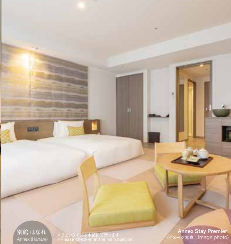
別館 はなれ Annex (Hanare)