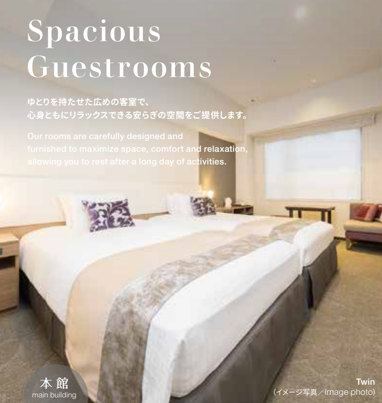
本館 main building

Our rooms are carefully designed and furnished to maximize space, comfort and relaxation, allowing you to rest after a long day of activities.