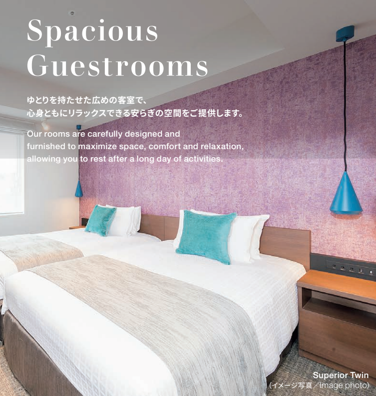
Superior Twin (イメージ写真 / Image photo)

Our rooms are carefully designed and furnished to maximize space, comfort and relaxation, allowing you to rest after a long day of activities.