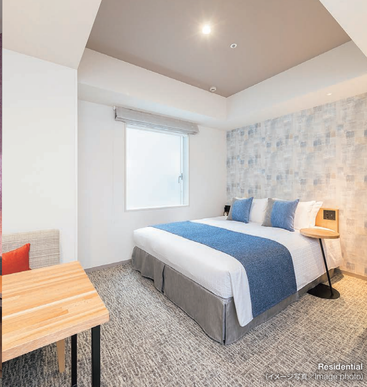
Residential (イメージ写真 / Image photo)