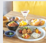
盛付例 (写真はイメージです) Serving sample