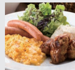
盛付例(写真はイメージです) Serving sample