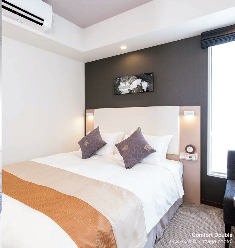
Comfort Double (イメージ写真/Image photo)