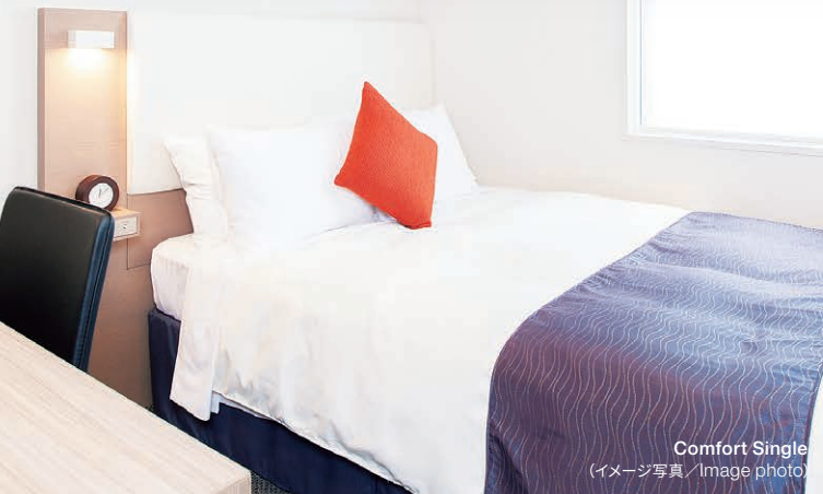
Comfort Single (イメージ写真/Image photo)

Our rooms are carefully designed and furnished to maximize space, comfort and relaxation, allowing you to rest after a long day of activities.