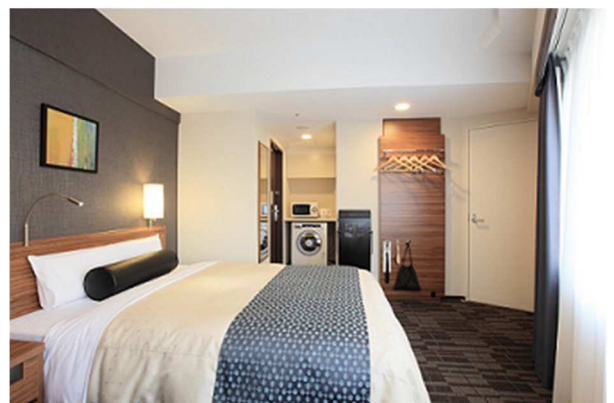
【西新宿店 客室内の洗濯乾燥機、電子レンジ等】