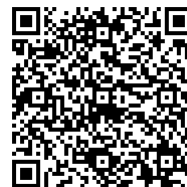
「東急ステイ 公式アプリ」